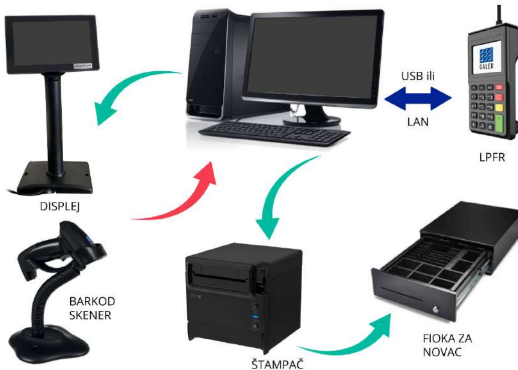
Slika 1. Predlog šeme povezivanja 1-na-1 gde se 1 ESIR povezuje sa 1 LPFR uređajem